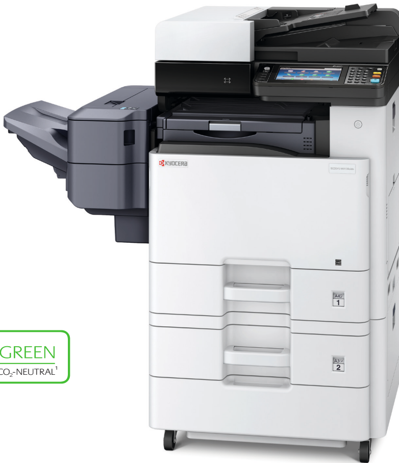
Abb. zeigt ECOSYS M8130cidn mit Optionen